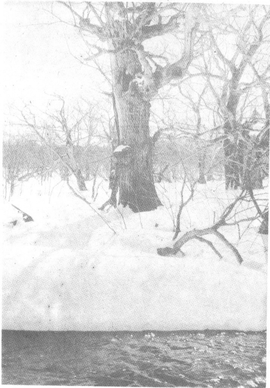
Рис. 2. Гнездо рыбного филина в дупле чозении. О-в Кунашир, р. Саратовская, март 1985 г.

и лиственные деревья. В частности, у самки, загнездившейся в пойме р. Саратовская, присада-столовая располагалась в 100—150 м от гнезда за рекой, на краю елово-пихтовой куртины, на старой сухой ели без вершины. Осенью и зимой мы вспугивали птиц, сидящих днем в кронах елей, пихт и старых ив с толстыми сучьями, растущих непосредственно у реки или на краю поймы. Деревья-присады не выделялись на общем фоне, не «бросались» в глаза наблюдателю, но в то же время обеспечивали сидящей на них птице хороший обзор местности. Видимо, благодаря